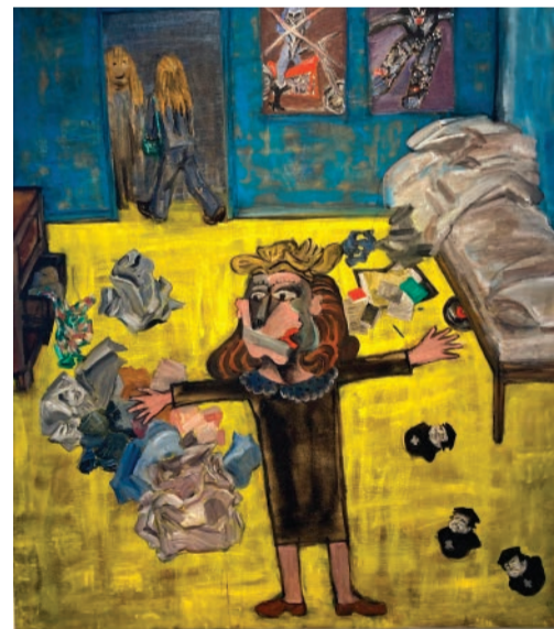
"Konstnären som tonårsmorsa". En målning av Anna Sjö Dahl kan ses på Hälsinglands museum.